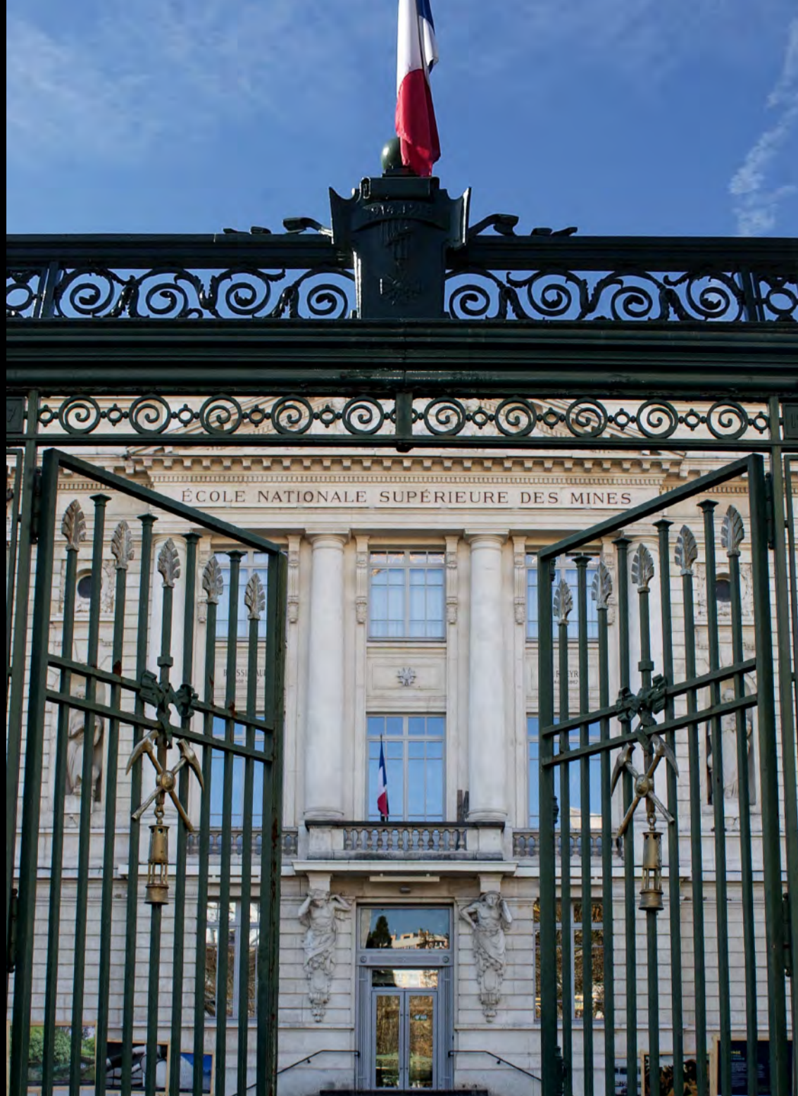
Plate-forme Intelligence Artificielle